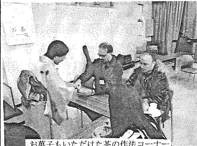
お菓子もいただいた茶の作法コーナー