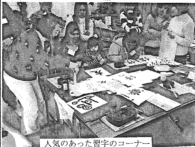
人気のあった習字のコーナー