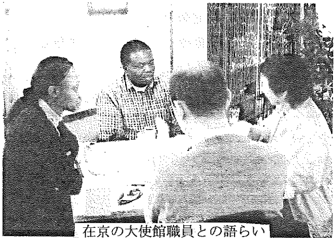
在京の大使館職員との語らい