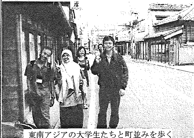
東南アジアの大学生たちと町並みを歩く