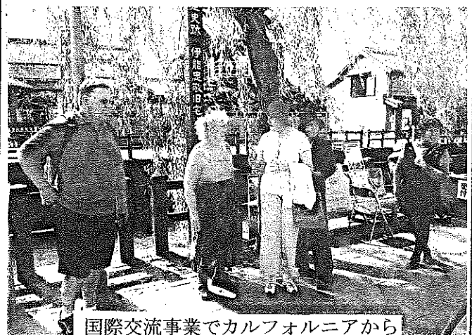
国際交流事業でカルフォルニアから