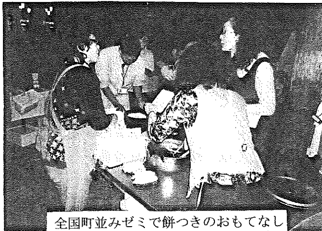
全国町並みゼミで餅つきのおもてなし